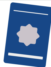
Foto | Qualificação Civil | Todos Os Registros | Páginas De Fgts | Anotações Gerais | Pis